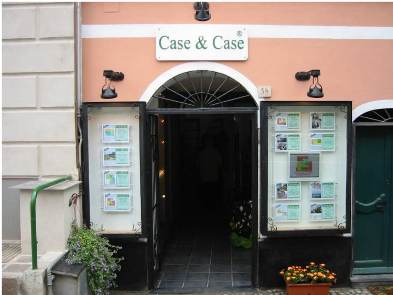
Modulo specifiche immobile scaricato dal sito dello studio Immobiliare Case&Case di Celle Ligure