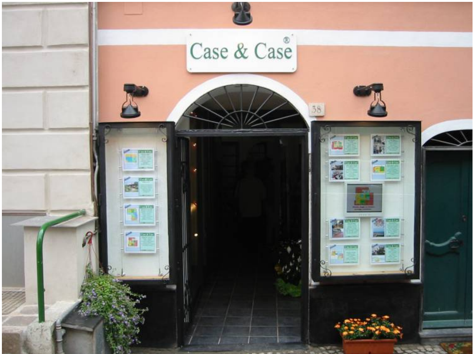
Modulo specifiche immobile scaricato dal sito dello studio Immobiliare Case&Case di Celle Ligure